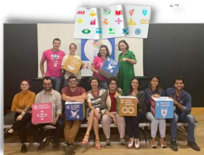
Seminário em Lages 4/08/22