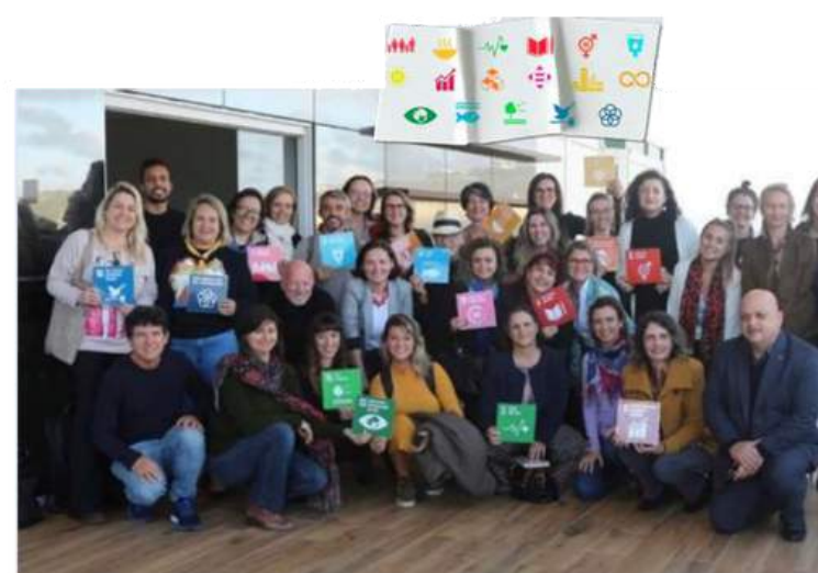
Seminário em Florianópolis 15/09/22