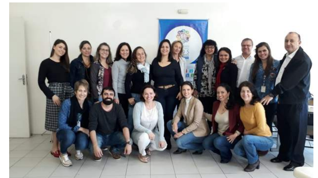
Capacitação para gestores