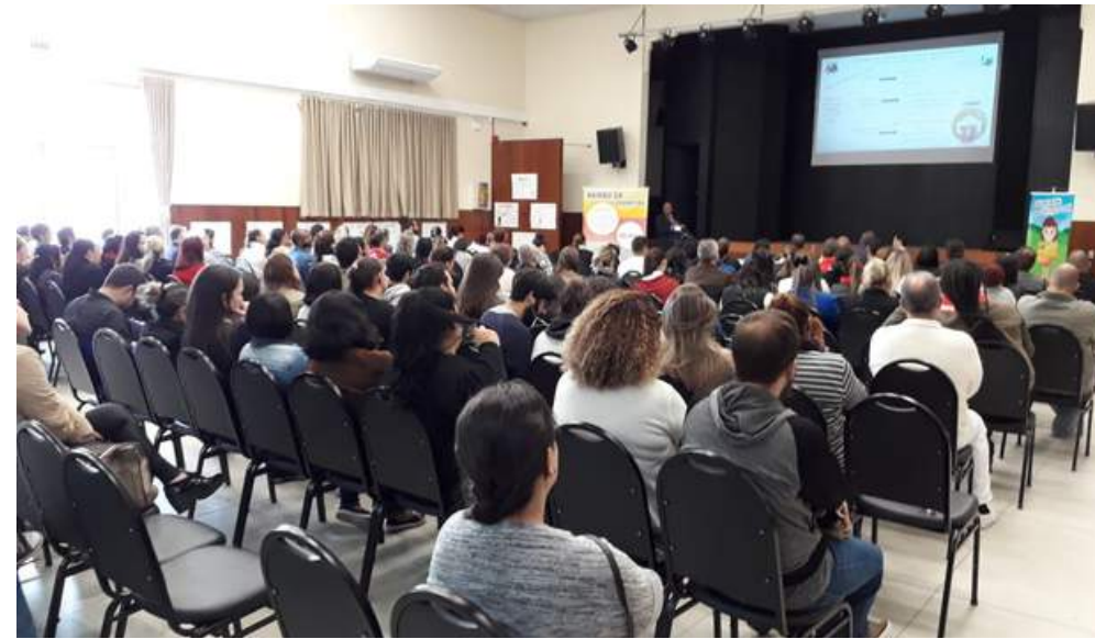
Capacitação para gestores