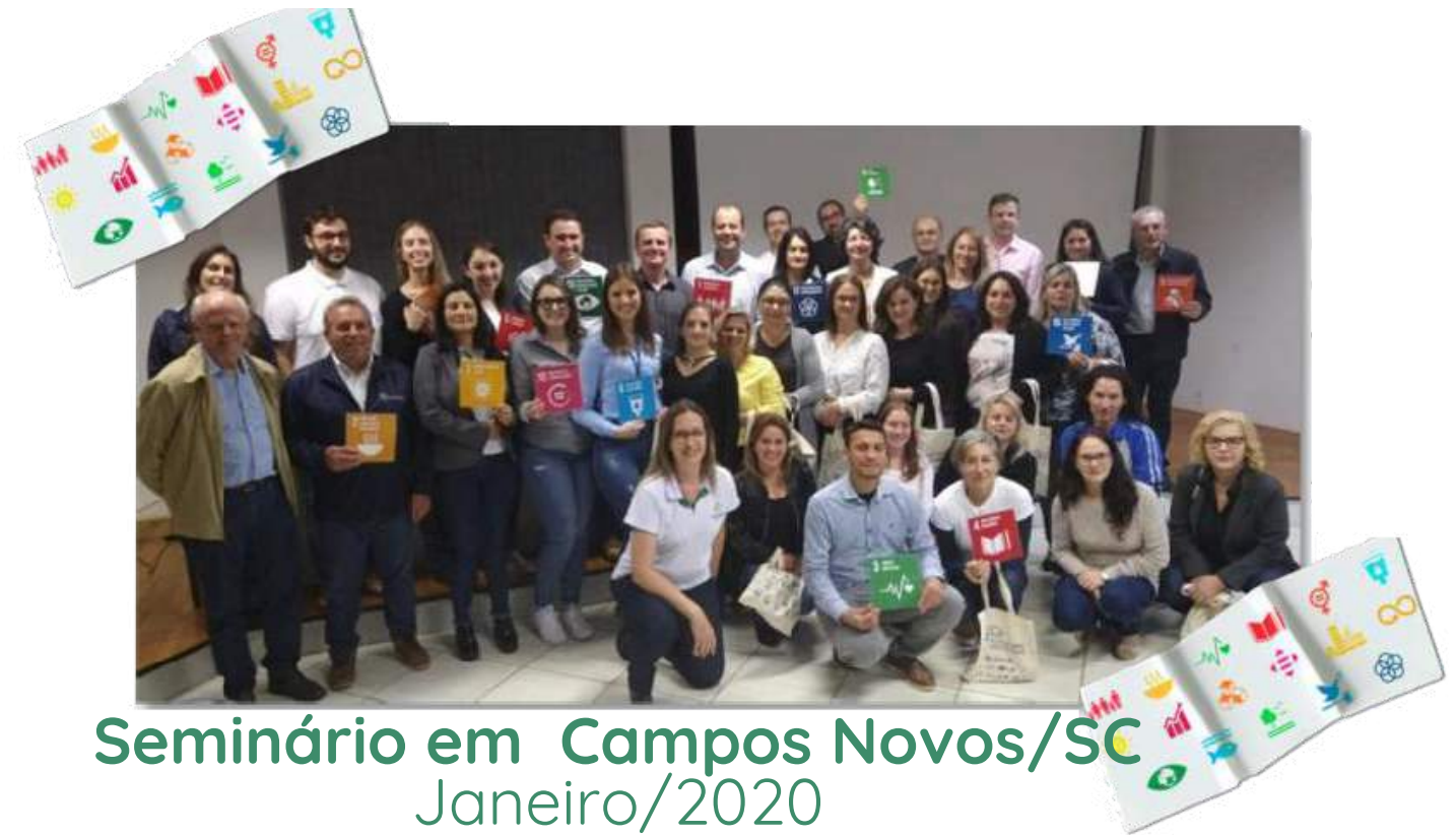
Seminário em Campos Novos/SC Janeiro/2020