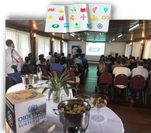
Seminário em Lages 4/04/22