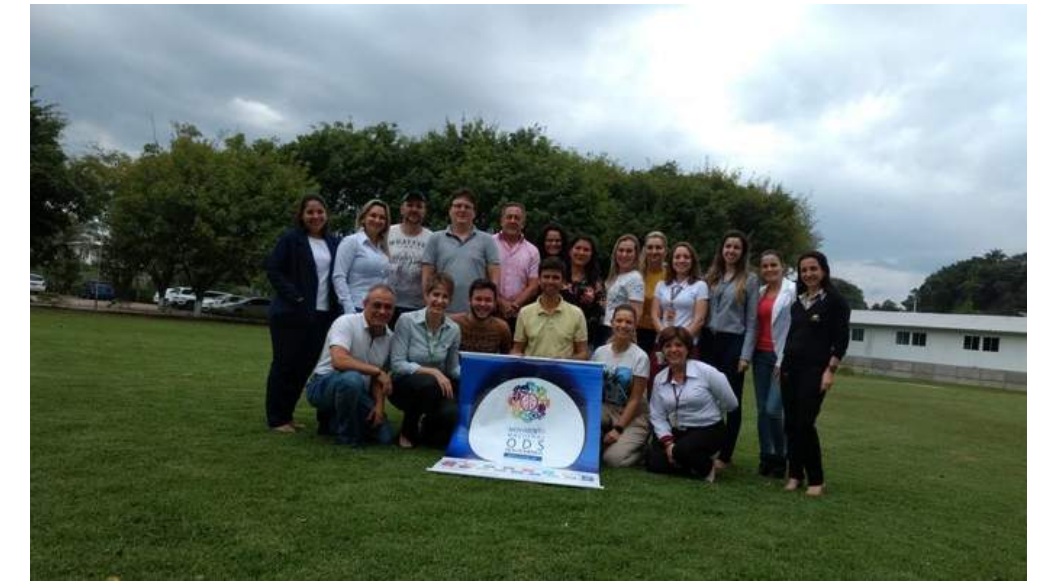
Capacitação para multiplicadores