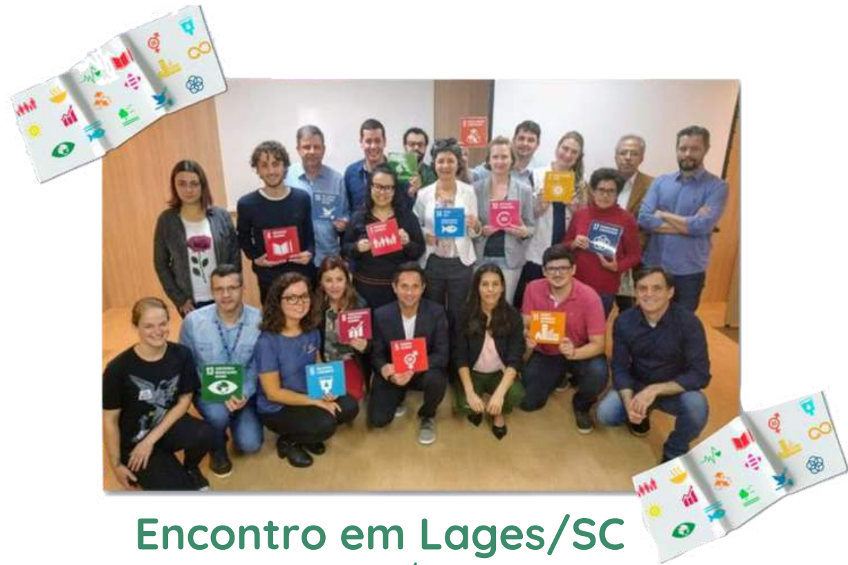
Encontro em Lages/SC Janeiro/2020