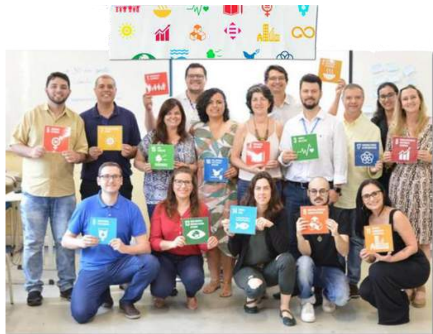
Encontro Tubarão/SC Fevereiro/2020