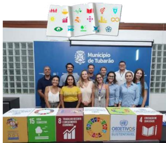
Seminário em Tubarão 13/05/22