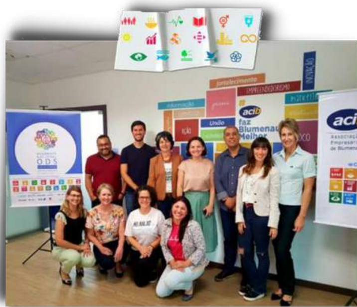
Seminário em Blumenau 19/10/22

Em 2022, assim como nos anos anteriores, também conseguimos realizar vários eventos e ações, diferentes municípios de SC, com o objetivo de engajar mais pessoas e organizações no alcance da Agenda 2030.