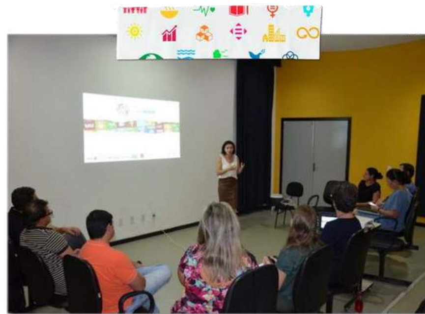
Seminário em Criciúma/SC Fevereiro/2020